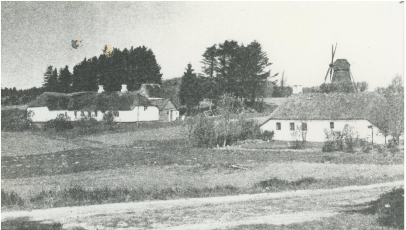
Brødlandgaard, Brødlandhus og sagførerens mølle.