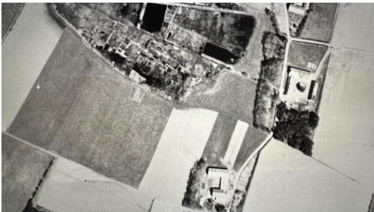
Foto fra 1954, findes på Krak.dk. Sdr. Møgelmose er gården nederst på billedet. Gården i midten er Møgelmosegaard. Lige overfor ses Møgelmosen. Eller Storemosen, Møgel er et gammelt dansk ord for Stor.

Jeg gik til præst i Horsens/Langholt og blev konfirmeret i Vodskov kirke. Jeg blev konfirmeret i maj '55 og kom derefter, som 14-årig, i lære ved Brugsen i Vester Hassing. Der var jeg i 5 år, hvorefter jeg kom til flyvevåbnet – først i Jonstruplejren i 4 måneder og herefter til Flyvestation Aalborg i 6 år.