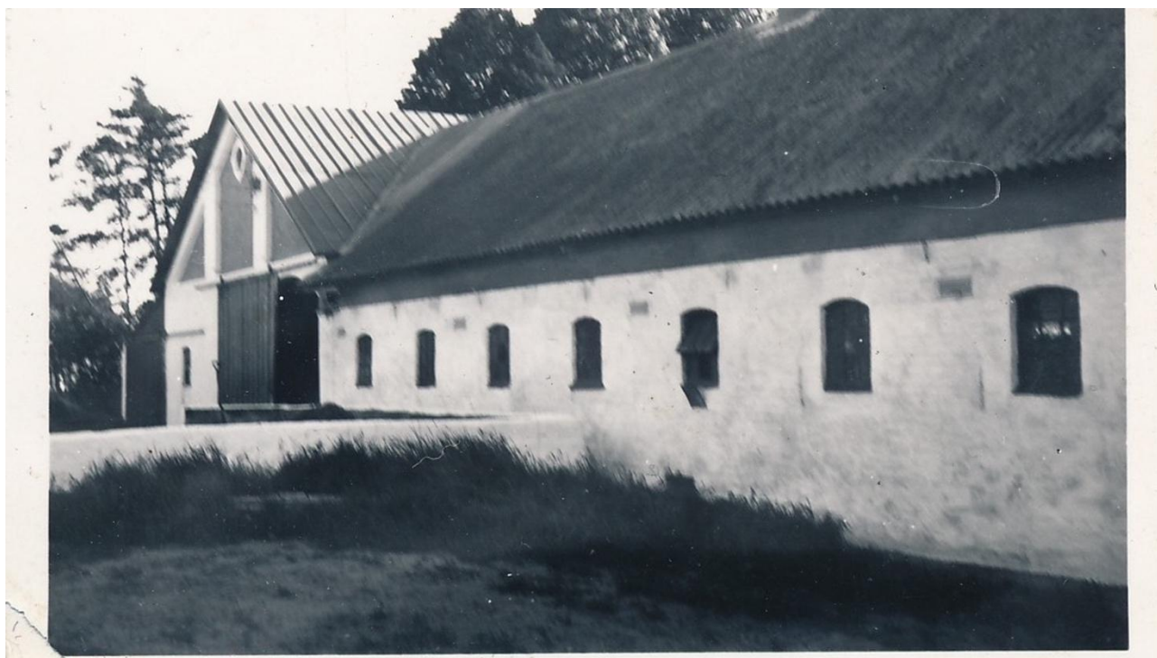
Lade og stald på Sdr. Møgelmose

Når grisen var slagtet, var der en blære, hvor grisen havde sin urin; denne blev tømmt og tørret. Når den var tørret, så kunne vi bruge noget af den ved at spænde den over en krukke og sætte et halmstrå ned i midten af skindet på beholderen. Så virkede den som en rumlepotte, der lavede en frygtelig larm, når vi skulle have det sjovt nytårsaften.