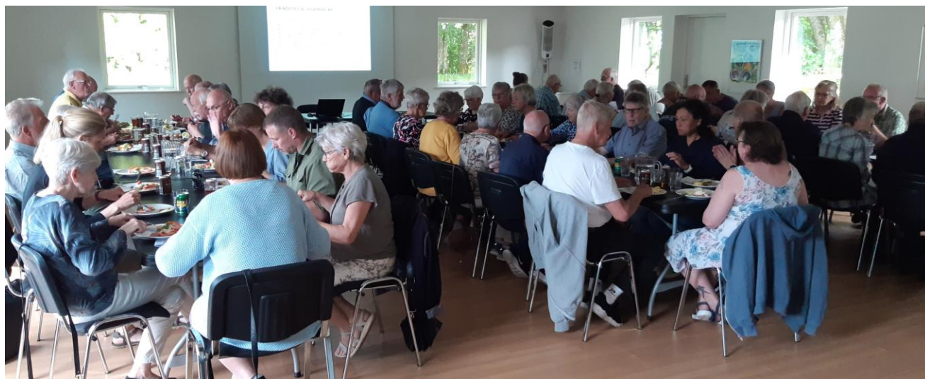
Et udsnit af deltagerne ved Samrådets generalforsamling i Kultur- og Borgerhuset.