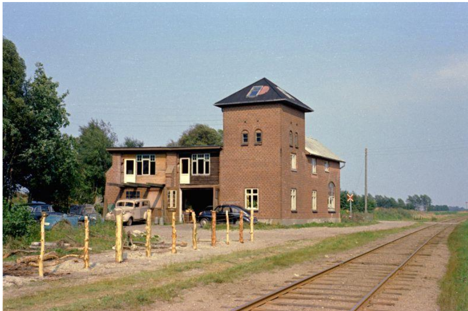
Vodskov-Østervrås nedlagte remise 1965.

Markant i landskabet er stadig den gamle remisebygning i Vodskov. Man er ikke i tvivl om dens funktion, når man i dag betragter bygningen.