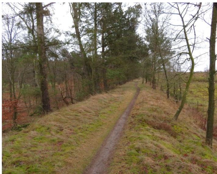
Vodskov-Østervrå banetrace februar 2022

Et andet tydeligt spor er banetraceet, som ses i området mellem Attrup og Uggerhalne i den østlige udkant af Hammer Bakker. I dag et yndet vandringsspor for motionshungrende borgere fra Vodskov, her kan de krydse ligesindede fra Grindsted og Uggerhalne.