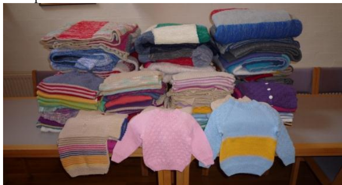
"En sæsons produktion"

i Sognegården. Der startes med en sang fra højskole-sangbogen, herefter drikkes der kaffe og snart har damerne gang i strikkepindene. Mændene finder bobspillet frem.