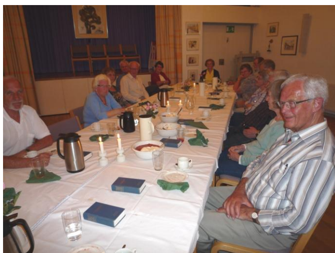
"Fællesspisning i foråret"