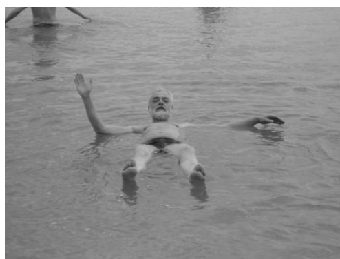
Her med en bilsen fra Det Døde Hav

Vi vil gerne mødes med alle interesserede for at se, om det skal lykkes for os at samle et hold på 20 eller flere. Turen vil få en helt aktuel præsentation fra en lille uges kort besøg i starten af februar i år.