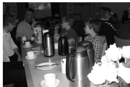
Morgenkaffe i Sognegården

Folkekirkens Nødhjælp siger, at aldrig før har så mange sogne deltaget, i alt deltog 1308 sogne. En del sogne manglede indsamlere – det var også det, vi oplevede i Hammer sogn – vi håber, de trofaste indsamlere vender tilbage næste år.