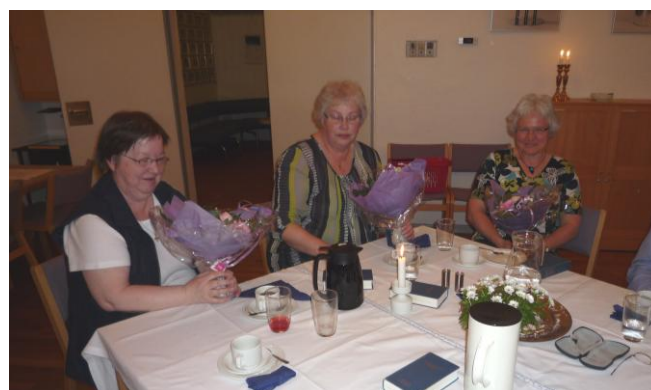
Det aktive madhold – 2011

Jeg kan ærlig talt ikke huske, hvor tit spisningerne fandt sted i starten, men de sidste mange år har vi haft 6 spisninger årligt.