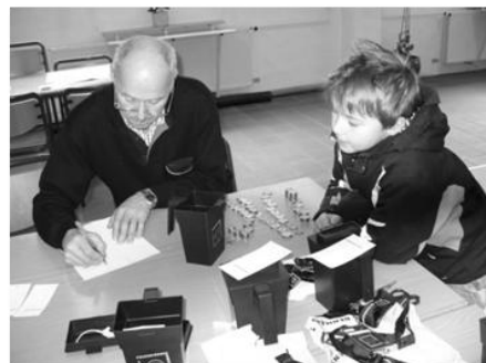
Der tælles penge

I hele pastoratet blev der indsamlet i alt 11.451,25 kr. På landsplan godt 15 millioner ind til kampen mod sult og katastrofer.