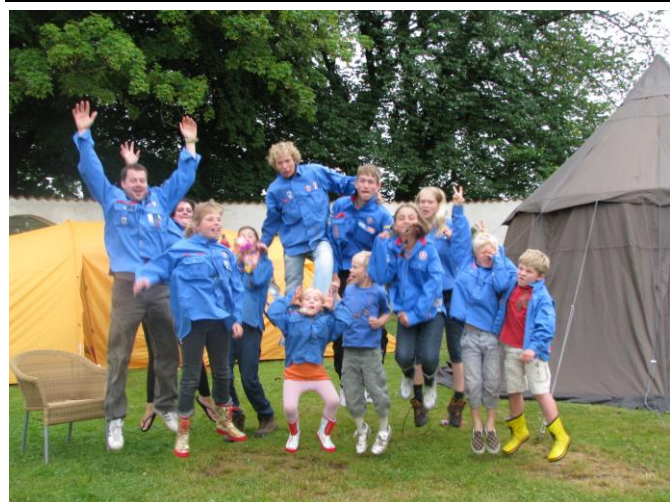
Klar til årets lejr!