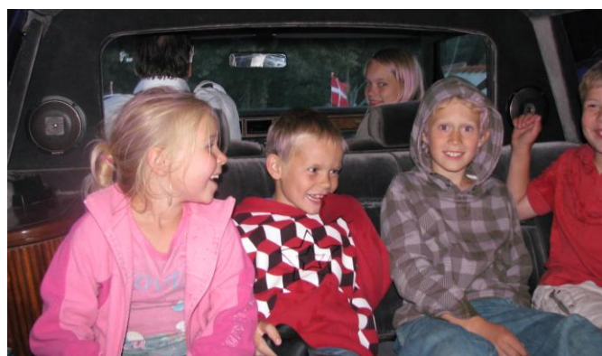
På vej til årets lejr!

Torsdag, den 27/8 kl. 18,30 er der møde i sognegården for "gamle" medlemmer og "nye", der kunne tænke sig at være med i FDF (fra børnehaveklasse og opefter).