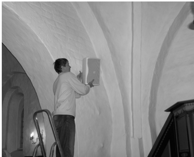
"Lydmanden" i færd med at sælge sin vare til kirken!

Monteringen af lydanlægget i kirken er nu tilendebragt og de sidste justeringer af teleslynge – højtalere og mikrofoner foretages i denne