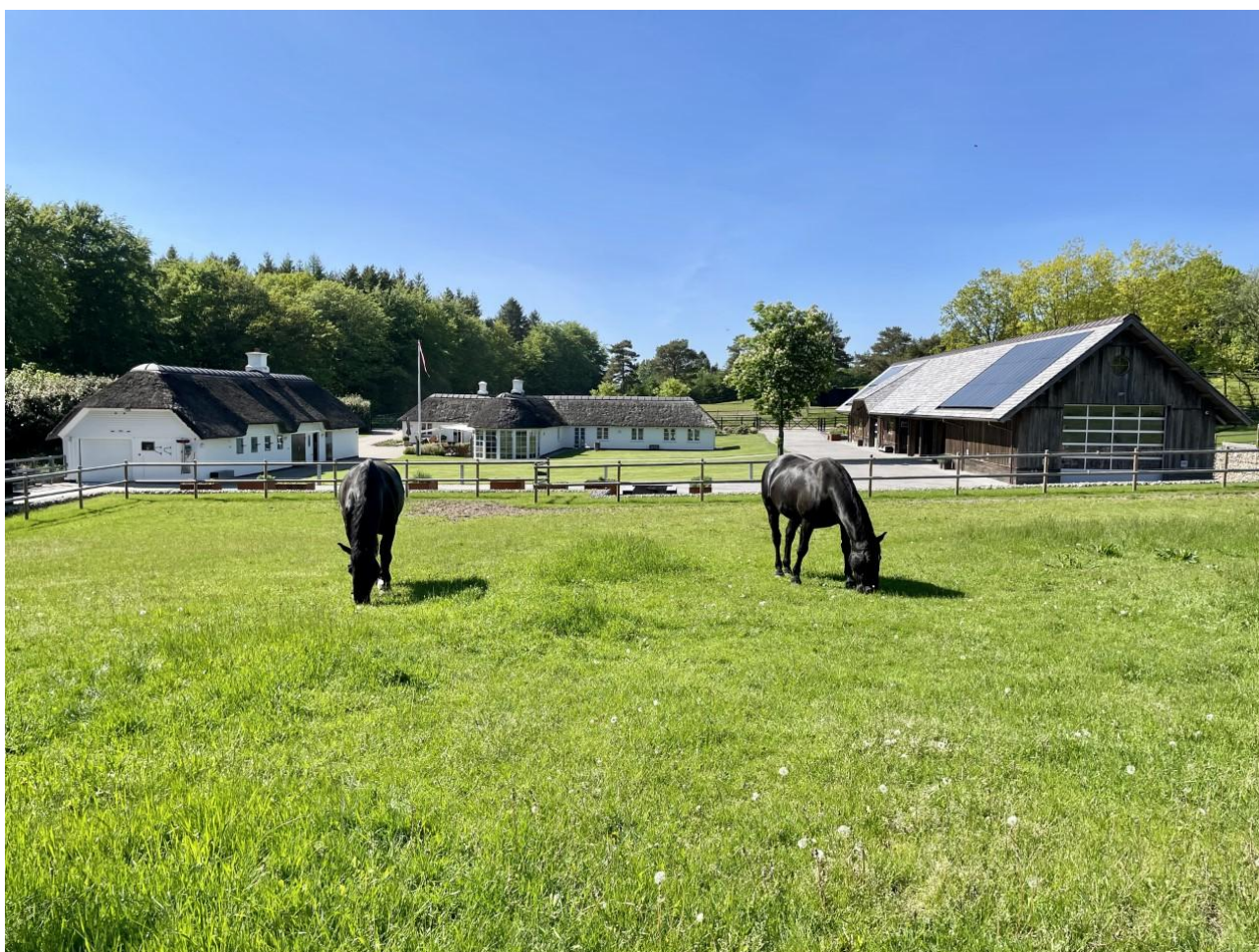
Øster Torndal foråret 2021 set mod vest.

Hertil kommer andre bygninger, som passer stilfuldt ind og samlet leverer en harmonisk helhed. Det understøttes af græsklædte marker til hestene. Her står opstammede solitære fyrretræer, som er en fryd for øjet! Alt passer utroligt smukt ind i det omkringliggende bakke- og skovlandskab. En skovejendom som forbi passerende kan nyde i fulde drag.