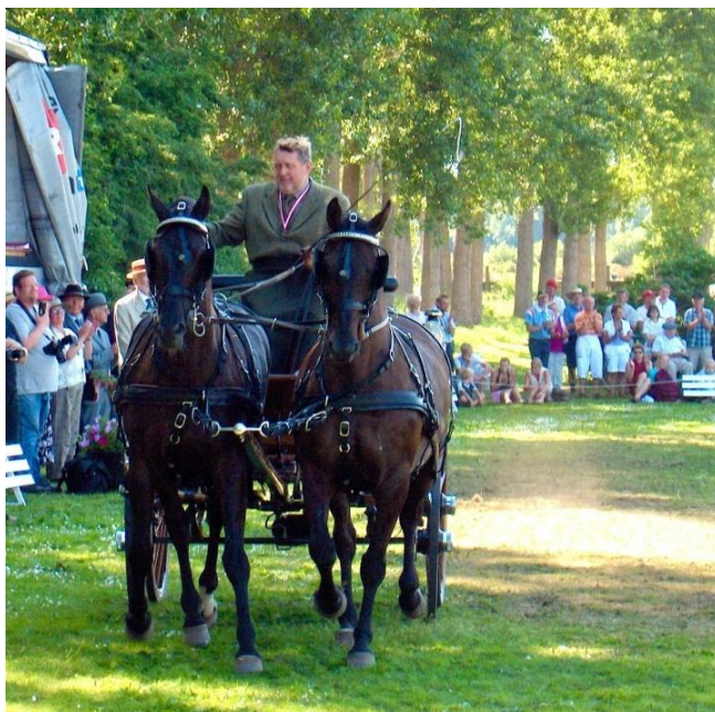
Fotografier fra forskellige nationale og internationale konkurrencekørsler.