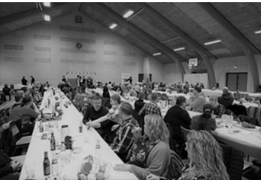
Arrangementer i hallen