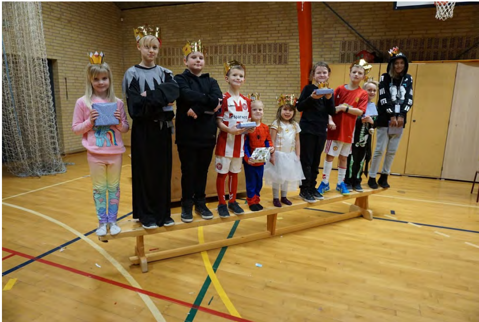
Der var fine præmier til alle!