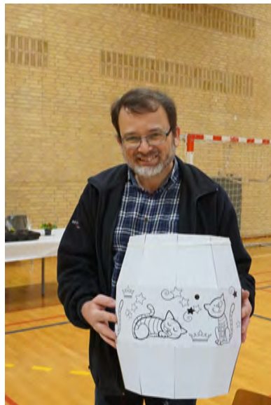
Anders samlede tønden til de små