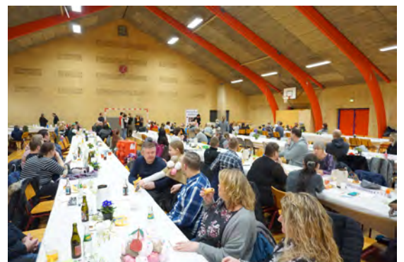
God hyggesnak med naboerne

Udgives af Grindsted-Uggerhalne Borgerforening og Hammer Menighedsråd.