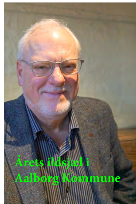
Årets ildsjæl i Aalborg Kommune

organisation. Et særkende ved vort Samråd er, at man opfordrer borgere uden for bestyrelsen til at gå ind som aktive medlemmer for at involvere flest mulige borgere og derigennem skabe engagement og ejerskab. Det gælder bl.a. udvalgene for byudvikling, byforskønnelse, ungeudvalg og anlæg af cykelsti.