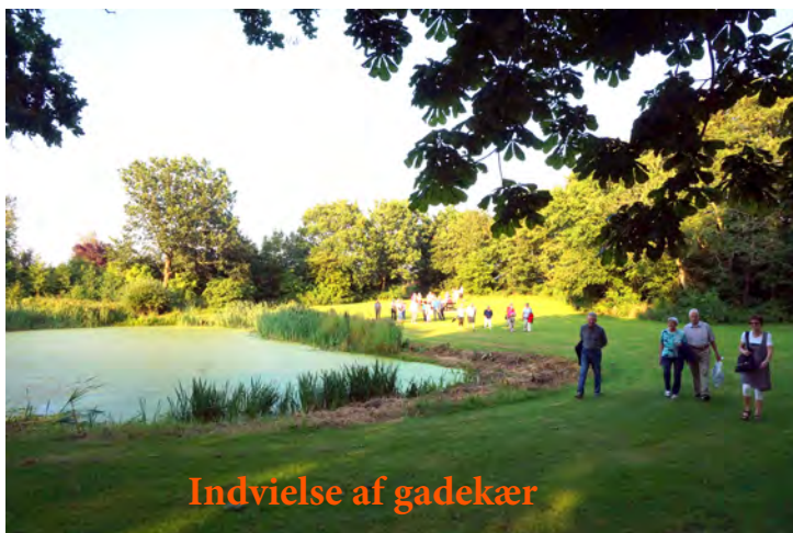
Indvielse af gadekær

Der arbejdes fortsat med etablering af ’købmand’ med forsamlingshus, café og lignende – hvor præcis det bliver, må næste år afgøre.