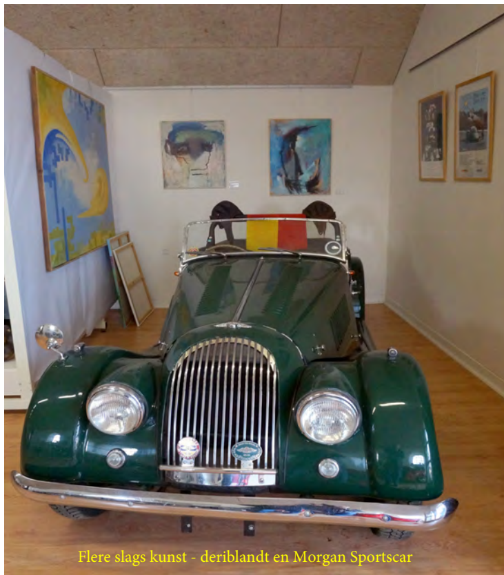
Flere slags kunst - deriblandt en Morgan Sportscar