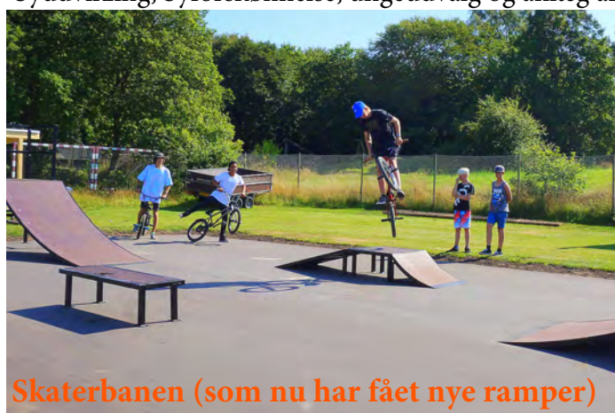
Skaterbanen (som nu har fået nye ramper)