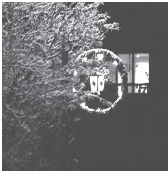
Den gamle julebelysning