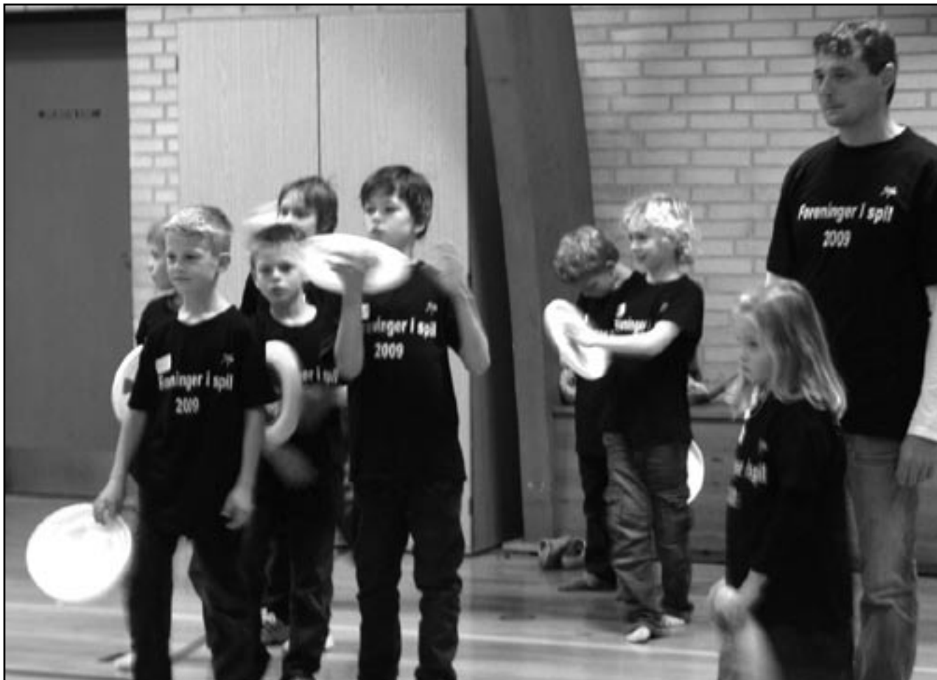
” At det kræver stor koncentration at kaste med frisbee ses tydeligt”