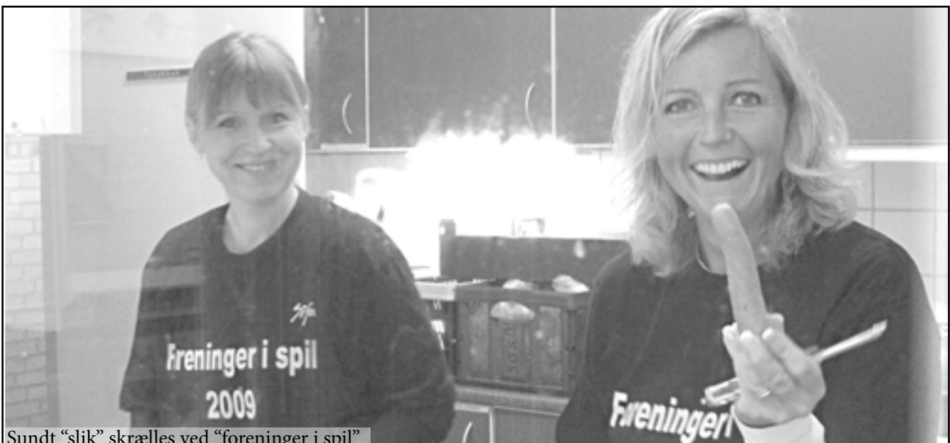
Sundt "slik" skrælles ved "foreninger i spil"

I relation til arrangement "foreninger i spil", hvor også sund mad var vægtet højt, har vi hentet denne artikel fra Kristeligt Dagblad den 14. november 2009.