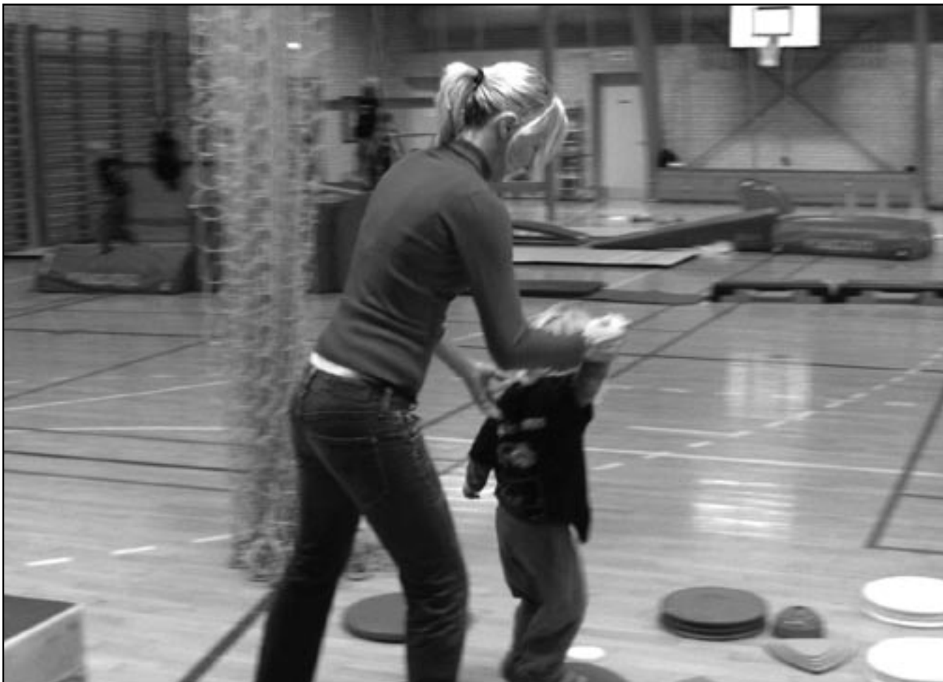
” Selv de helt små havde stor glæde af arrangementet ”