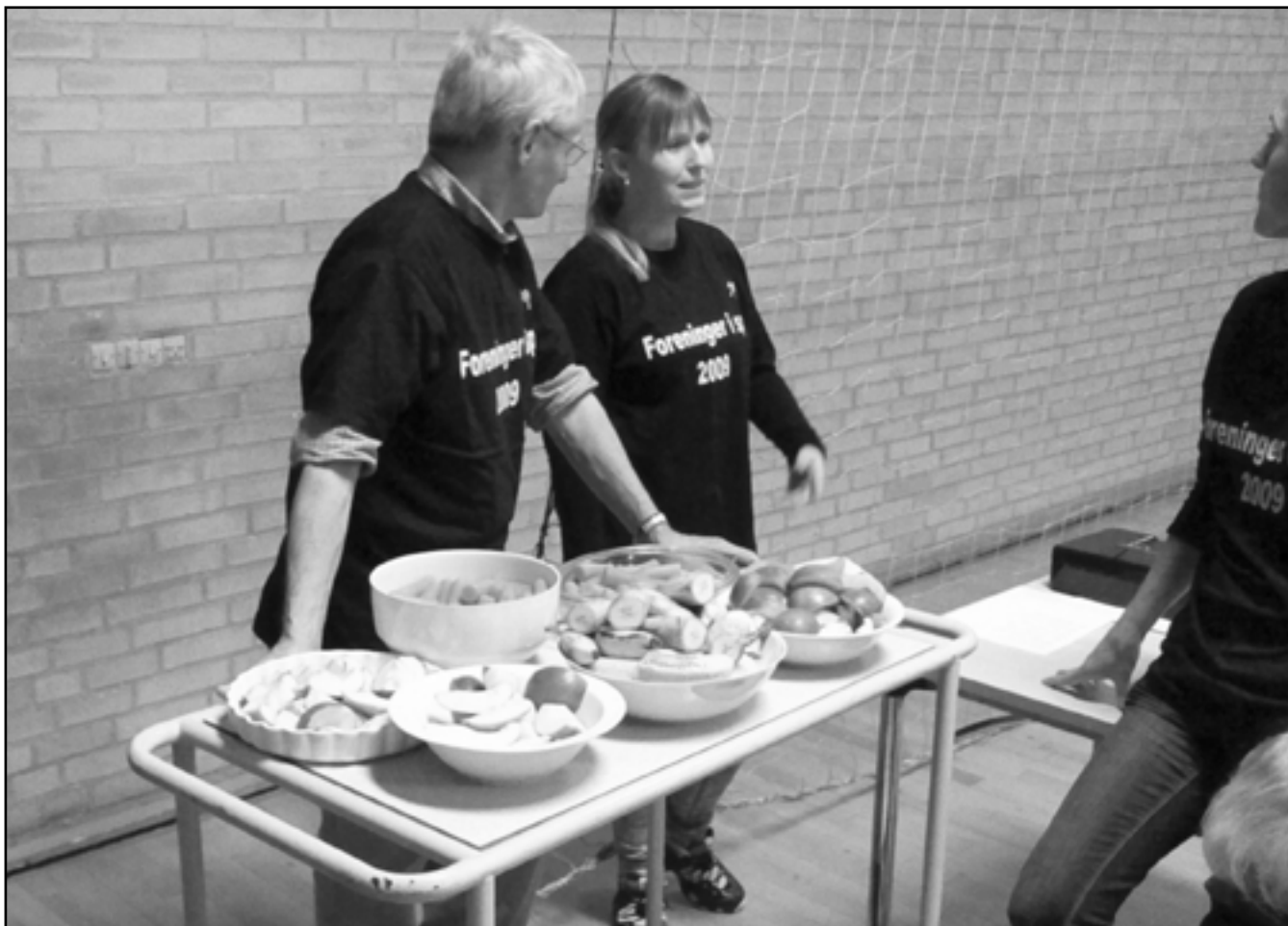
Arrangementet "foreninger i spil" bød på masser af frugt til ungerne.