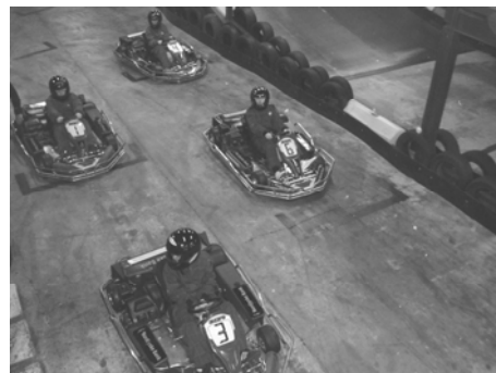
Motiv fra udflugtsdagen i februar