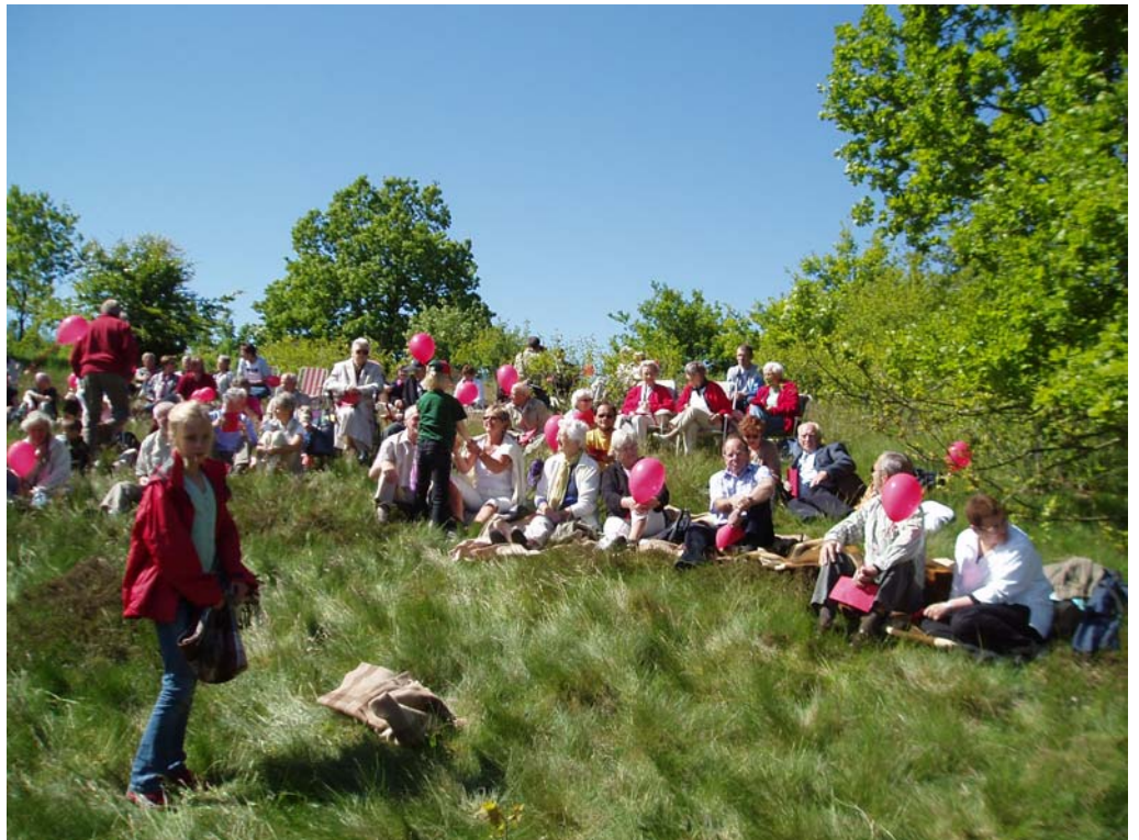
Glimt fra pinsen 2006!

I håb om godt forårsvejr indbydes til årets PINSE-GUDSTJENESTE i det grønne, midt i Hammer bakker. Pinse betyder Helligåndens komme, så vi hører Guds ord og gerninger på vort eget sprog, så vi forstår og tror. Derfor lyder budskabet i år på mange sprog, når det nu er et budskab til alle i hele verden. Derfor sætter vi os sammen og deler med hinanden, brød og vin til altergang, og frokost i det grønne! Velkommen til at fejre, at vi er fælles og sammen som mennesker sendt til verden med ånd og kraft, liv og brød. Glædelig pinse!