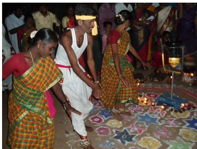
Indtryk fra festen på Dialogcentret Quo Vadis

Onsdag den 11. januar 2006 besøgte vi Dialogcentret Quo Vadis i Tiruvannamalai til en tværreligiøs meditation og forberedende Pongalfest, en traditionel stor indisk høstfest, som holdes hvert år i januar. Fra Danmark deltog to grupper præster på studierejse. Fra Indien var der den lokale dialoggruppe, præster og andre kristne fra flere kirker, samt nogle hinduer og muslimer.