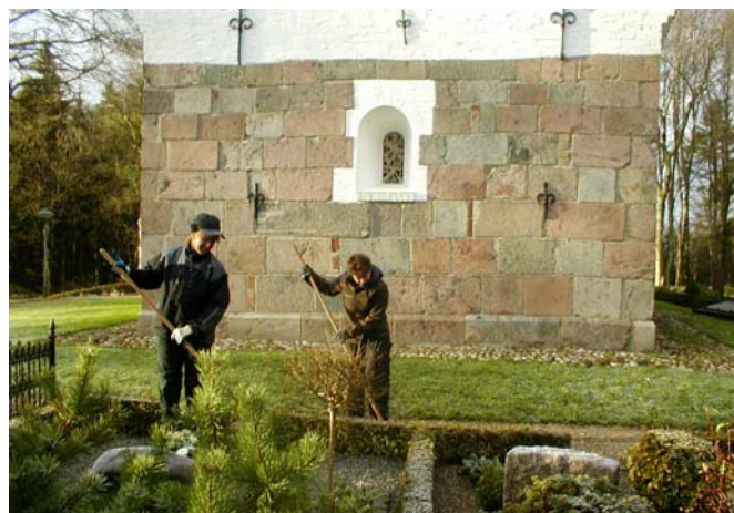
Gravsteder og kirkegårdens gange skal holdes rene

Der er forskellige regler for de øvrige kirkelige handlinger: barne dåb, konfirmationer, bryllupper, begravelser og bisættelser.