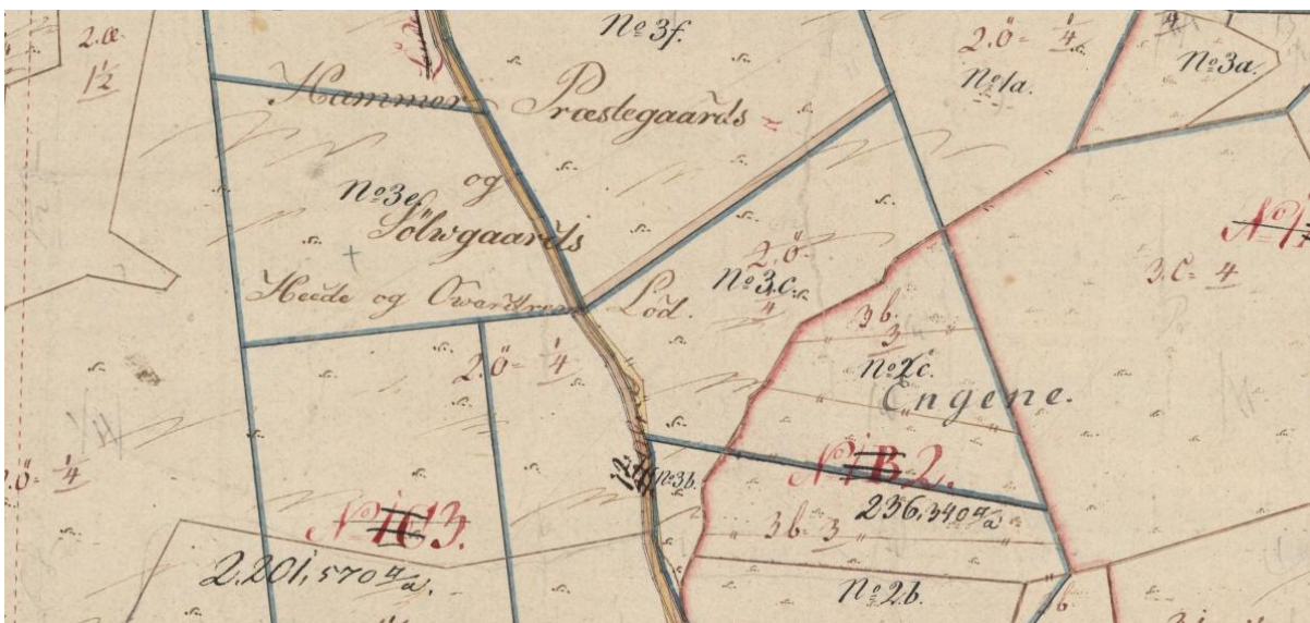
På Ejerlavet Hammer Præstegaard og Sølgaards Jorder 1812 – 1866, opmålt 1803 ses teksten: "Hammer Præstegaards og Sølwgards Lod".

På matrikelkortet fra 1803 står der øverst oppe "Hammer Præstegaards og Sølwgards Lod"! Hvordan det W har sneget sig ind er uvist, for officielt hedder kortet: "Kort over Hammer Præstegaards og Sølgaards og Bielidts Jorder udi Hammer Sogn beliggende i Aalborg Amt, Kiær Herred, opmaalt 1803 af Rønnow copi af Kaalund."