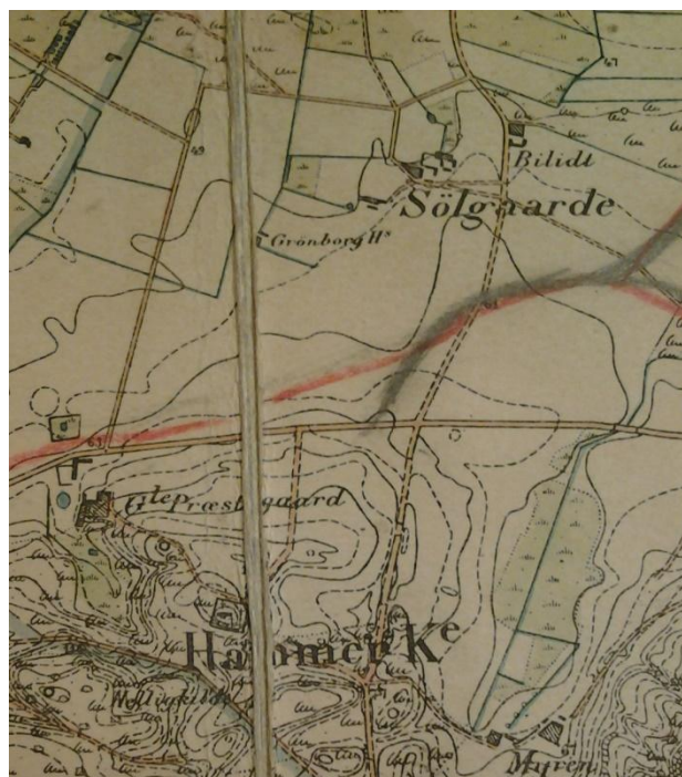
Generalstabens Topografiske Kort 1885 hvor Kongevejen fra Hammer Bakker fortsætter nordpå forbi Sølgaardene og Bilidt. Kort i Rigsarkivet Viborg.

Kongevejen, der var hovedvejen til det indre af Vendsyssel, fortsatte nordpå gennem Hammer Bakker og mandede ud lidt øst for Hammer Kirke et par hundrede meter vest for den tidligere Hammer Præstegård, i dag kaldet Hammergaard. Vejen fortsatte forbi Sølgaardene mod nord til Skarvad, hvor den forlod Kjær Herred og fortsatte ind i Jerslev Herred på sin vej ad Hjørring til, i tidligere tider Vendsyssels hovedby.