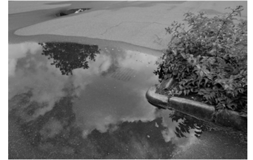
- og vi kan arbejde tørskoet!