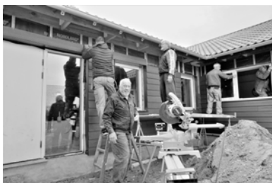
Den faste stok