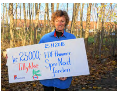
En glad kredsleder med en smuk check til bålhytten !!!