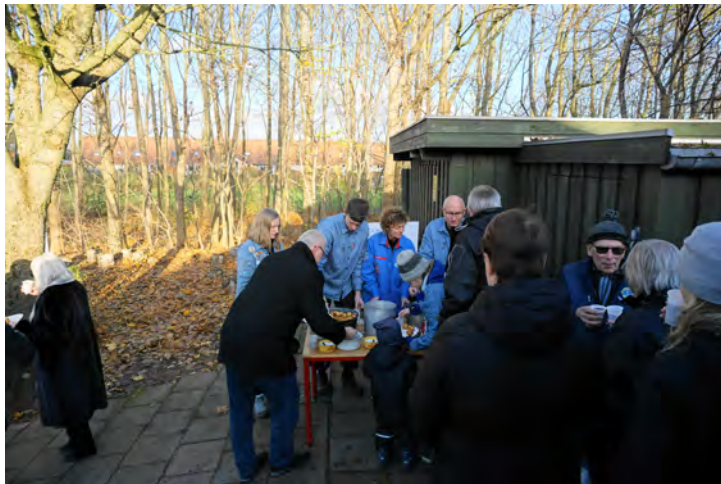
Der var lækre æbleskiver og gløgg til alle, og snobrød til også!