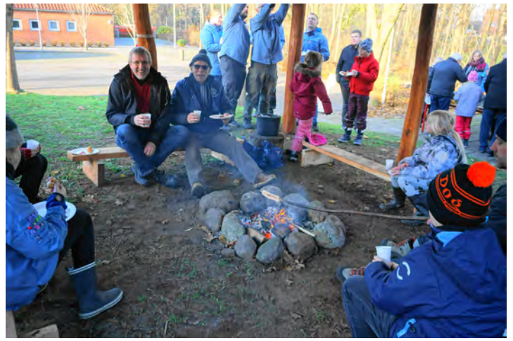
Den flotte overdækkede bålplads kom straks i brug