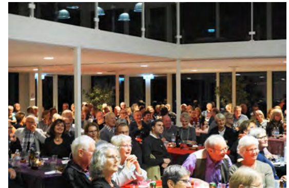
Velbesøgt koncert med 226 deltagere