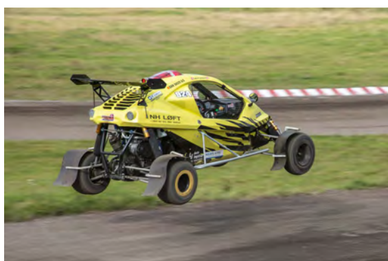
Akrobatisk kørsel er Søren's speciale