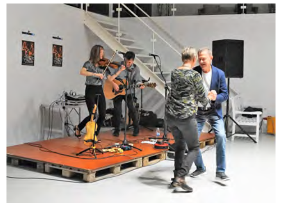
En lille swingom blev det også til!