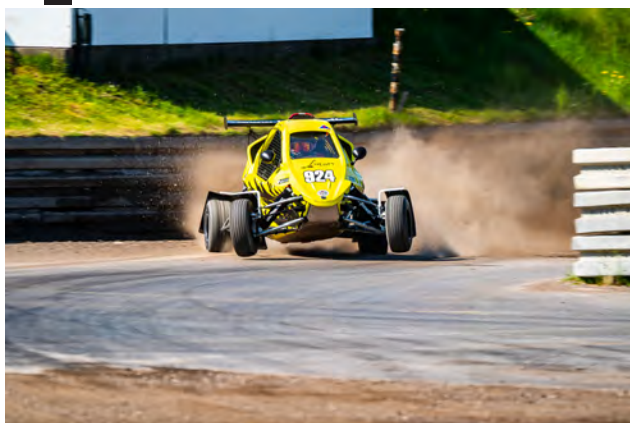
Med 150 i timen ind i svinget