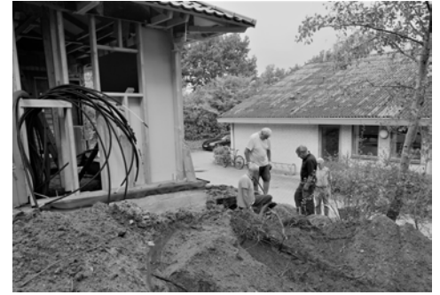
Det tungeste er overstået