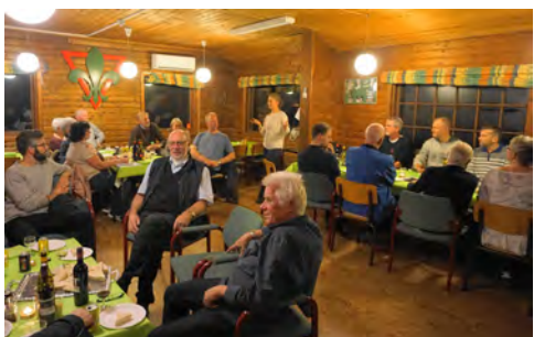
Midt i bakkerne blev der holdt et hyggeligt afsluttende møde