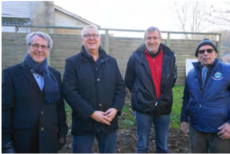
Nogle af de fremmødte sponsorer - her Lions og Spar Nord