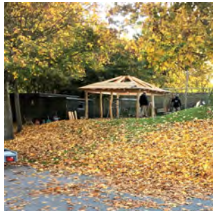
Fra opførelsen af hytten - se tekst side 20