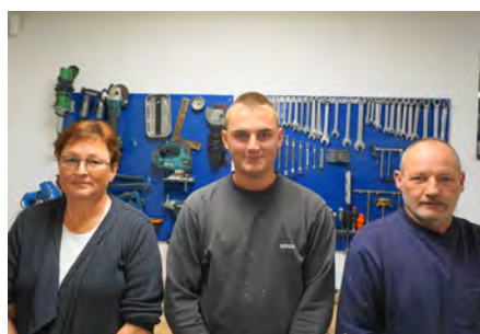
Team Jelsbak styrer garagen