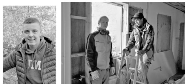
De dygtige lærlinge fra Tech College Aalborg