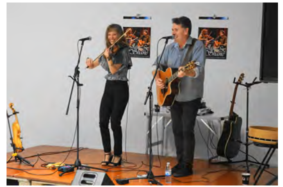
Enestående spilleglæde og publikumstække

Stor ros til Samrådets kulturudvalg for at have skabt denne aften, som oven i købet havde lokket folk til fra nabobyerne - sågar et par helt fra Fyn!