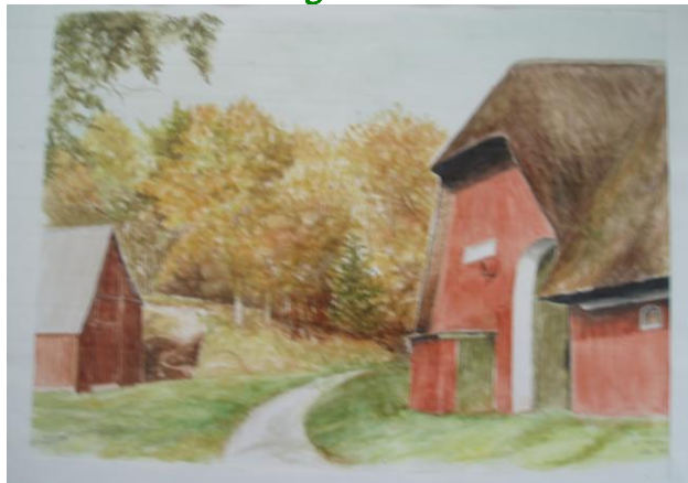
Vita Mathiasen: Maleri og skitser