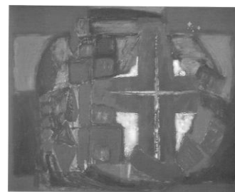
Orientering og historisk rids

Læs det selv og glæd evt. en af dine venner med sådan en lille hilsen.