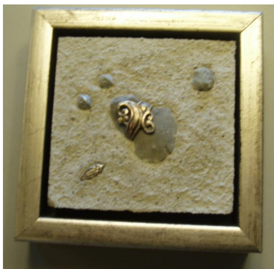
Jane Sørensen: Relief