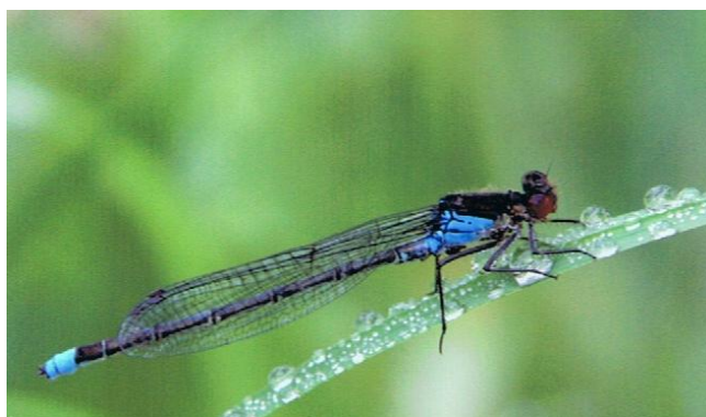
Frede Burholt: Foto "Tæt på naturen"