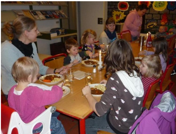
Efter Spaghetti-gudstjenesten i marts