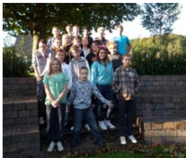
Konfirmanderne på torsdagsholdet – de rigtige! (Sidste gang var det altså onsdagsholdet)