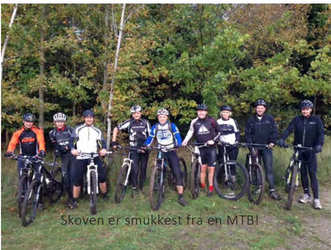
Skoven er smukkeste fra en MTB!

Til sommerfesten har Raketterne – sammen med GIF – arrangeret børnecykelløb med efterfølgende familiespisning. Det har været en stor succes med mange deltagende børn og stor opbakning fra forældre og sponsorer.