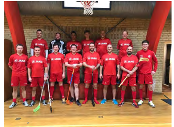
Herreholdet i kampklar opstilling