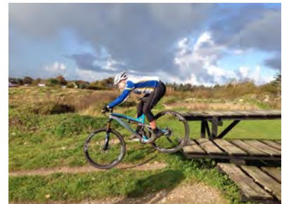
Teknikken er i højsædet

I løbet af året er der også en række motionsarrangementer hvor Raketterne deltager: vi har været til MTB-marathon i Aalborg, Saltum-klassikeren, 24-timersløb i Rold og meget andet. Vi er også et par stykker der har deltaget i mindre triathlon-stævner (Svømning – cykling-løb) – og konstateret at nogle har lidt udfordringer i det våde element.