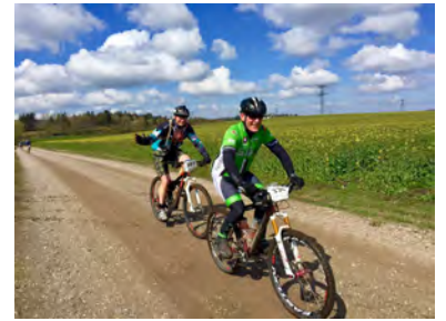
Ud i det åbne landskab!