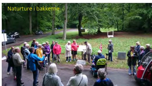
Naturture i bakkerne