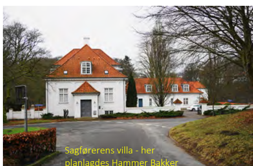
Sagførerenes villa - her planlagdes Hammer Bakker