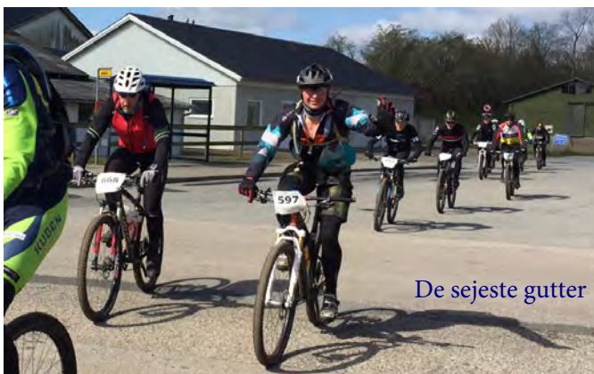
De sejeste gutter