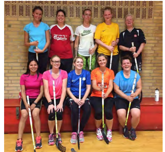
Klar til tirsdagstræning: højt humør!