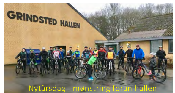
Nytårsdag - mønstring foran hallen

Meld jer ind Facebook-gruppen og foreslå nogle arrangementer – så er du med til at skabe liv i byerne! Claus