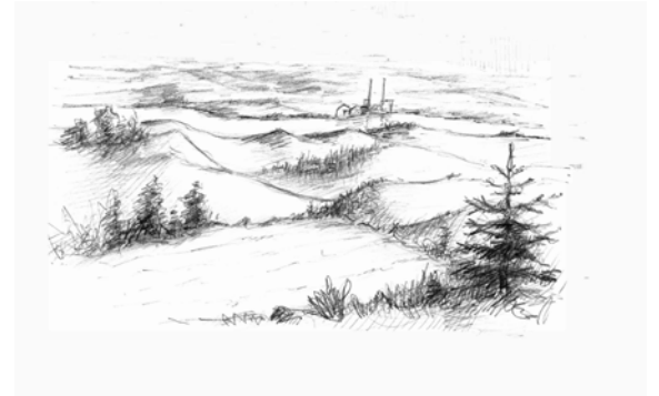
Fjorden set fra Vestbjerg Bakke