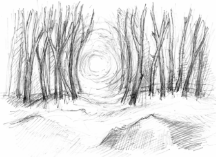
Lyset i Paradisdalen

Tegningerne her er lavet til digtsamlingen 'Hammerglimt'.