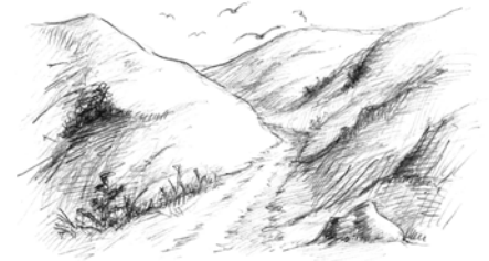
Heden - som den var engang