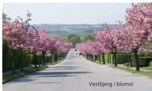
Vestbjerg i blomst