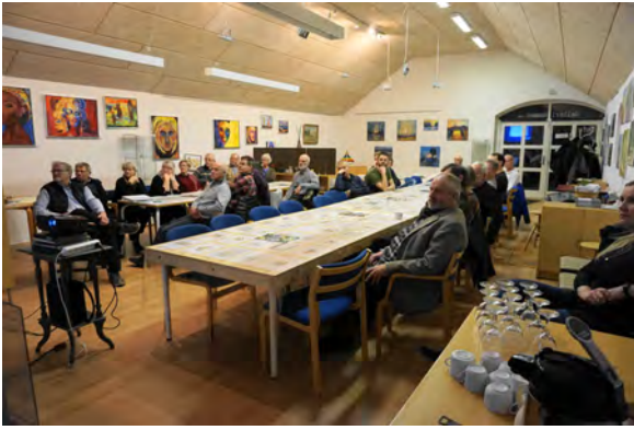
Hyggelig og positiv debat i Galleri Hammer