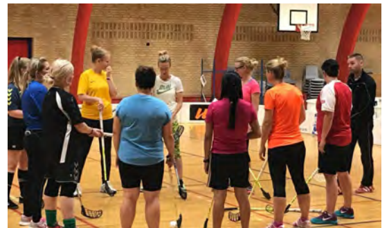
Teknikmøde og instruktion