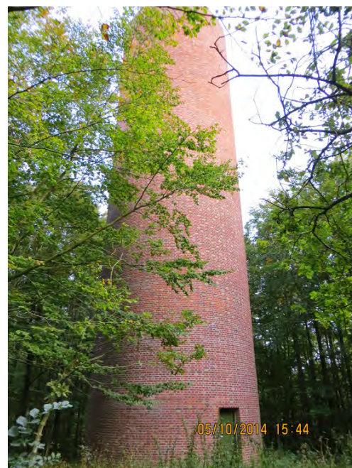
Landsbyklyngens ikon! Vandtårnet

Tekst og foto: Erling Larsen, Vodskov Samråd