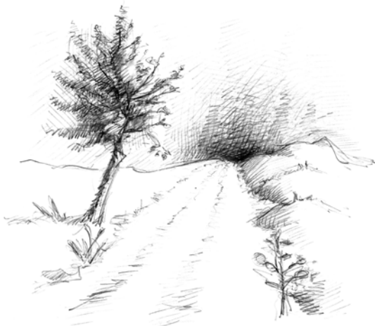
Vandringstur i aftenslumring