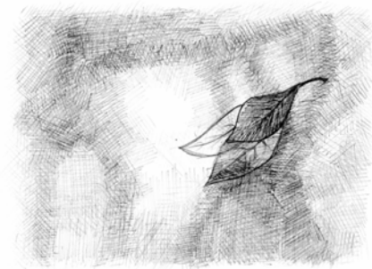
Løvfald når det er smukke