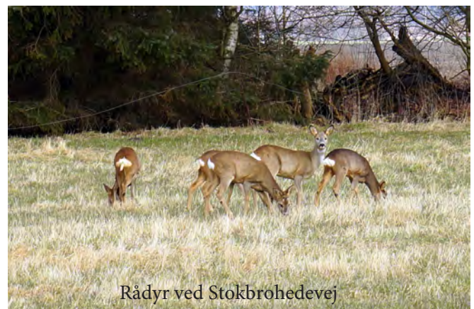
Rådyr ved Stokbrøhedevej