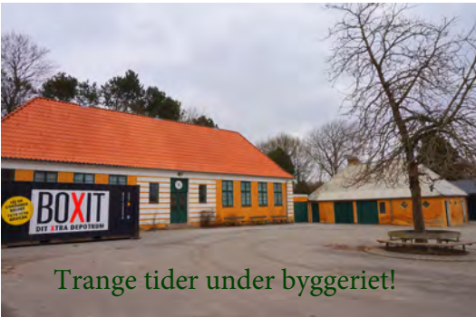
Trange tider under byggeriet!

DUS 2 og 0-6 klassetrin. Vi er i byerne privilegeret ved at have en institution, der fastholder og udvikler vor egenart ved at skabe helhed omkring det enkelte barn is et sammenhængende forløb fra børnehave til skole og DUS. Mange tilflyttere til Grindsted, Uggerhalne og omegn har opdaget, at dette er en af de store og betydende værdier ved vort område.