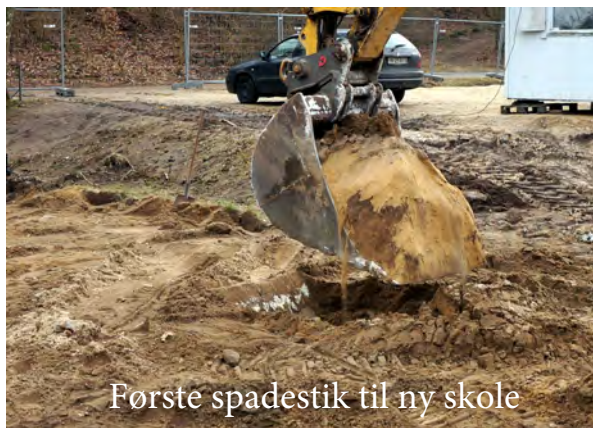
Første spadestik til ny skole

Der sker noget i Grindsted og Uggerhalne!