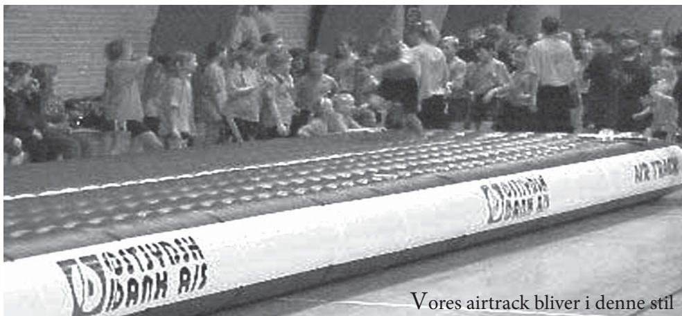
Vores airtrack bliver i denne stil

Tjek endvidere vores hjemmeside: www.grindstedsportsklub.dk