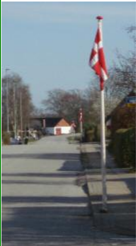
Flagalleen var oppe ved 75-års jubilæet i Grindsted, Uggerhalne og Omegns Borgerforening.