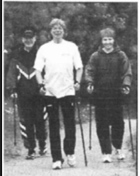
De tre der går stavgang, er taget fra en anden by.

Har du ikke prøvet det før er der instruktør til at hjælpe dig i gang.